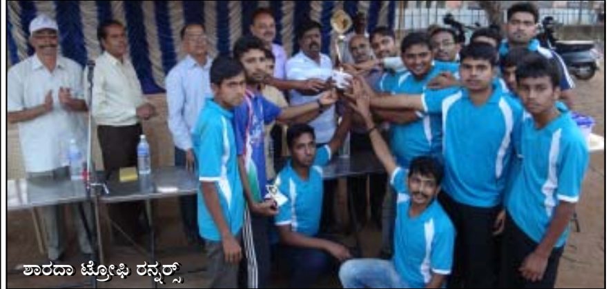
ಶಾರದಾ ಟ್ರೋಫಿ ರನ್ನರ್ಸ್

ಸತತ ಪ್ರಯತ್ನ, ಸಂಘಟಿತ ಹೋರಾಟ, ಹಾಗೂ ದೃಢ ಮನಸ್ಸಿನ ಆಟಗಾರರಿಗೆ ಫೈನಲ್ ಪ್ರವೇಶಿಸಿದ ಬೆಂಗಳೂರಿನ ಎಫ್‌ಡಬ್ಲ್ಯುಎಫ್ ತಂಡವು ನಂದಳಿಕೆ ತಂಡವನ್ನು ಮಣಿಸಿ ಶ್ರೀ ಶಾರದಾ ಟ್ರೋಫಿ-2014ನ್ನು ಗೆದ್ದುಕೊಂಡಿತು.