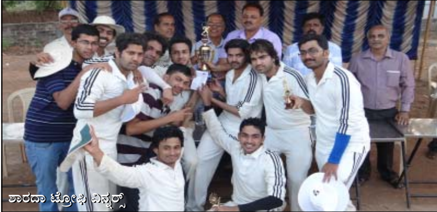
ಶಾರದಾ ಟ್ರೋಫಿ ವಿನ್ನರ್ಸ್