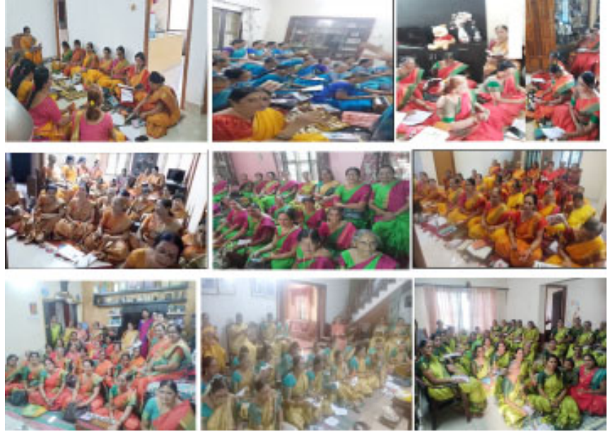
ಉಡುಪಿ ಶಾರದಾ ಭಜನಾ ಮಂಡಳಿಯವರಿಂದ ಮನೆ ಮನೆ ಭಜನೆ ಕಾರ್ಯಕ್ರಮ