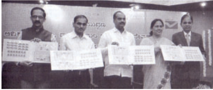
ಮುದ್ದಣ ವಿಶೇಷ ಅಂಚೆ ಚೀಟಿ ಲೋಕಾರ್ಪಣೆ